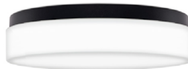
450 x 135 mm